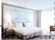
(写真は全てイメージです。)