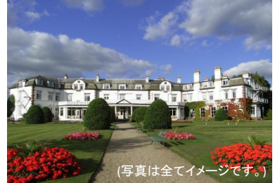
(写真は全てイメージです。)