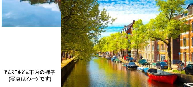
アムステルダム市内の様子 (写真はイメージです)