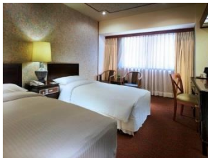
(写真は全てイメージです。)