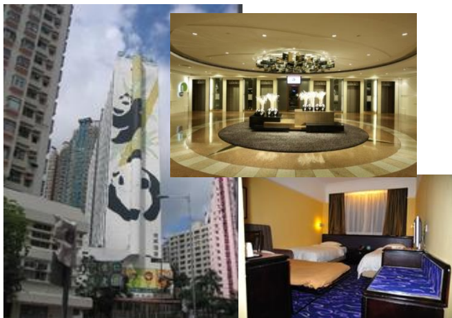
(写真は全てイメージです。)