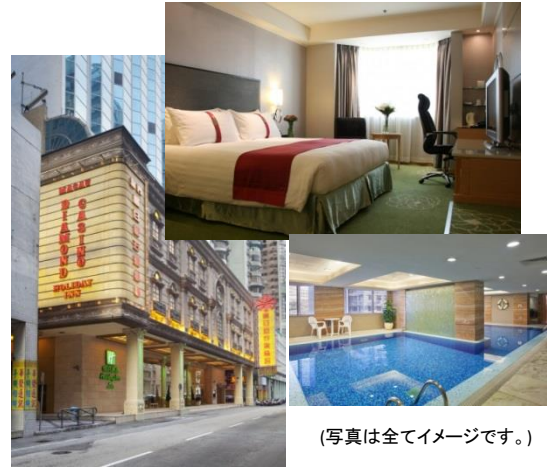
(写真は全てイメージです。)