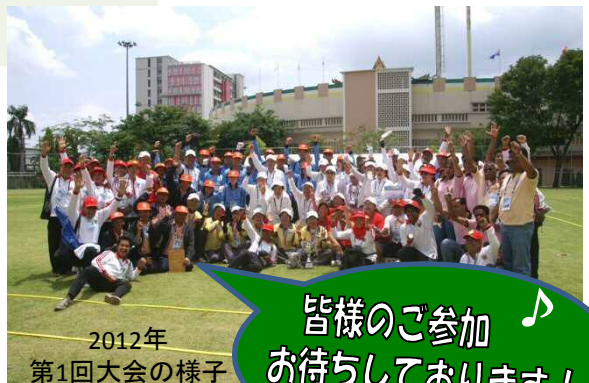
2012年 第1回大会の様子