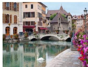
ジュネーブ市内の様子 (写真はイメージです)