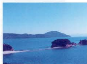
エンジェルロード