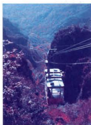
日本三大渓谷美 名勝 寒霞溪

小豆島には、オリーブ公園、醬の郷、寒霞溪等数多くの見所がたくさんありますので、ゲートボールを楽しんだ後、連泊なされて小豆島の観光もお楽しみ下さい。